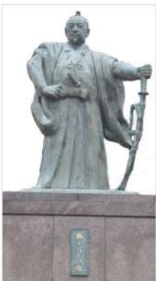
越前町織田地区にある信長公像

越前町織田は、織田信長公の祖先の地です。織田氏は織田荘の荘官として、また越前国二の宮劔神社の神官として代々劔大神に仕えてきた由緒ある家柄でした。